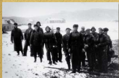
Les naufragés du Blue Comet sur la grève.