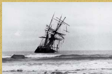
Naufrage du Llamar.

Trois-mâts Norvégien de 36 ans, avec 12 hommes à son bord, transportant des madriers. La brume eut raison du capitaine et de son bateau sur la côte ouest de Langlade.