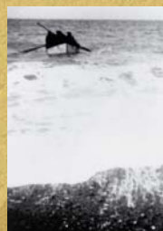
L'équipage du Blue Comet débarque sur la côte ouest de Langlade.