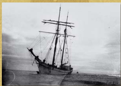
Naufrage du Guitou.