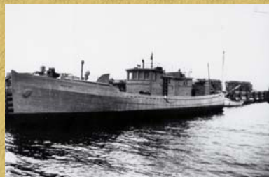
Le Bearcat quelques temps avant le naufrage.