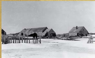
Ferme Larranaga.