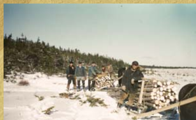
Transport de bois.

Le transport et la coupe de bois occupaient grandement l'emploi du temps. Les maisons étaient chauffées avec du bois de rivage, abondant à l'époque. Tous les matins l'approvisionnement était confié à un ou plusieurs hommes qui, par la même occasion, scrutaient le « plain » (rivage) à la recherche de tout objet utile qui viendrait s'échouer sur la plage. Cela faisait partie des rares moments appréciés par les hommes.