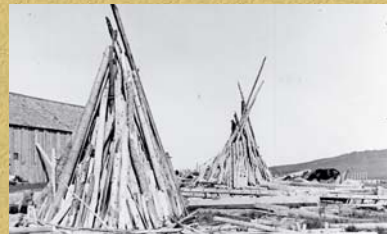
Réserves de bois.

Le lieu le plus utilisé était habituellement la cuisine : celle-ci, équipée d'un poêle à bois, ne manquait pas d'animer la grande pièce. Son activité quasi-permanente permettait de maintenir une grande « baille » d'eau chaude (récipient) tout au long de la journée et ainsi d'assurer les besoins de la vie quotidienne.