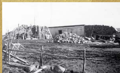
1945, provision de bois à la ferme de la Pointe au Cheval.

Les corvées les plus lourdes étaient certainement l'approvisionnement en eau et en bois. L'eau provenait de puits creusés ou des étangs voisins. On la captait à la main, c'est-à-dire avec des seaux ou des barils, et au mieux à l'aide d'une pompe. Mais les ennuis mécaniques étaient fréquents, surtout en hiver, lorsque la tuyauterie gelait, et il fallait alors embarquer des fûts vides sur la charrette et aller avec les bœufs au point d'eau le plus proche.