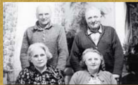
Derniers propriétaires.